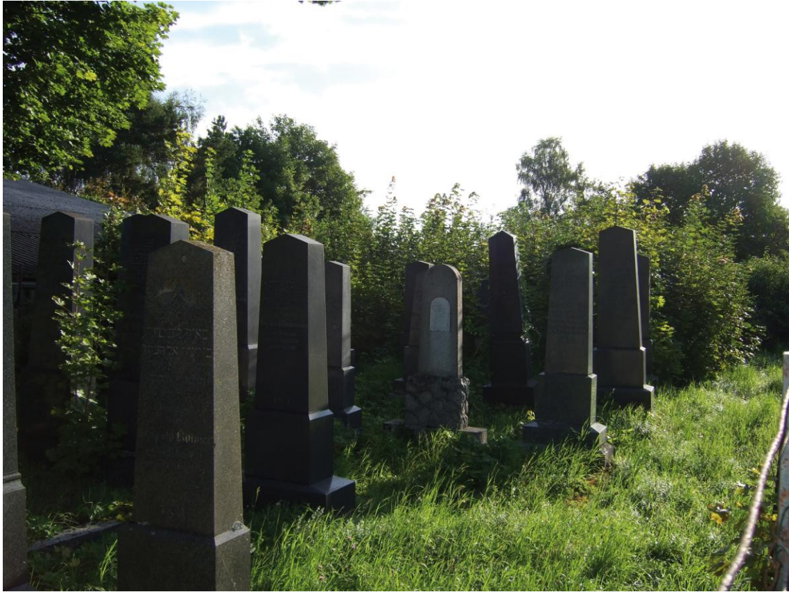
Text zu Bild (FriedhofVorher.JPG): Der Jüdische Friedhof vor dem Projektmarathon