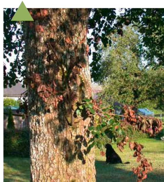
Form. Befallener Wassertrieb