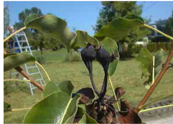
Frucht. Schwarze Birnen-Frucht